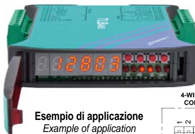
Esempio di applicazione Example of application